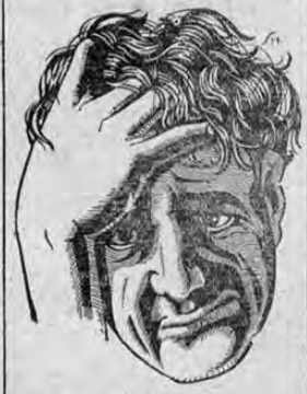
Alívese con Una ORIENTAL